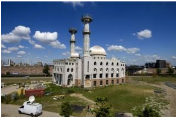
DEN HAAG - Moskee in Rotterdam.

19-03-2009 11:48 | Reformatorisch Dagblad